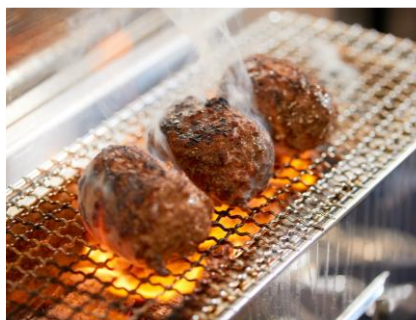
元祖 肉スタハンバーグ