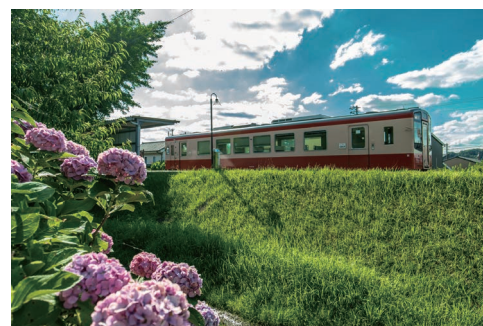
紫陽花と初夏の青空