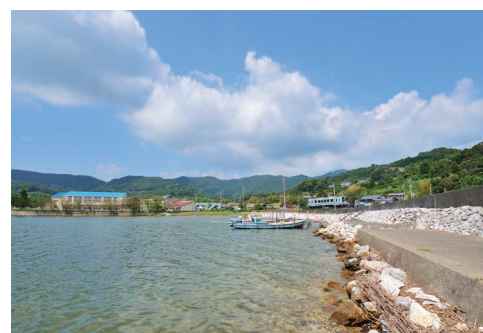
夏の浜名湖 - 西気賀付近