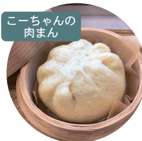
こーちゃんの肉まん