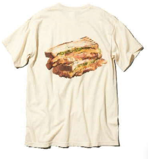
○インクジェットプリント