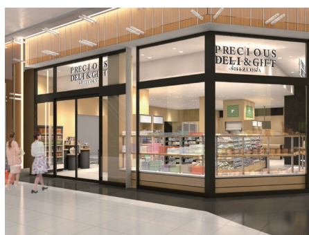
PRECIOUS DELI&GIFT SHIZUOKA

アスティ静岡ではJR静岡駅をご利用になるお客様、地域にお勤めやお住いの皆様に、より上質なライフスタイルをご提案します。