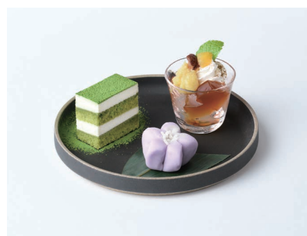
日本茶 きみくら JAPANESE TEA KIMIKURA